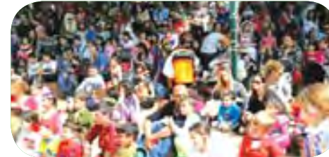
ועד פעילי השכונה מאחל לתושבי השכונה חג פסח כשר ושמח!

פניות לוועד השכונה, ניתן לבצע באמצעות כתובת המייל: em.vatika@gmail.com