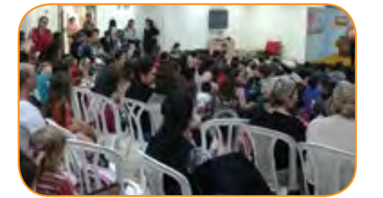
ב-300 הורים וילדים בהופעה חגיגתית במרכז הנוער והצעירים השכונתי

• סטטוס התקדמות פארק נוה גן - כפי שהתפרסם באתר השכונה, בפגישה של ועד נוה גן בתחילת פברואר בלשכת מנכ"ל העירייה סוכם כי מספר משרדי אדריכלים יוזמנו להציע סקיצות המתבססות על הקווים הכלליים שנבחרו עבור פארק נוה גן. מבין האדריכלים ייבחר מנצח (הבחירה תתבצע על ידי אנשי מקצוע ומספר נציגים מהשכונה), אשר יחל בתכנון המפורט של הפארק. לאחרונה ועד נוה גן סייע לאגף גנים ונוף בעירייה בהכנת מכתב פנייה לאדריכלים, הכולל מצגת על השכונה. כמו כן הועד עודכן כי התקציב לצורך התחרות הנ"ל כבר אושר על ידי מנכ"ל העירייה, בהתאם להנחיותו ולאישורו של ראש העיר עו"ד איציק ברוורמן אשר נותן לנושא פארק נוה גן עדיפות גבוהה ביותר - ועל כך אנו מודים לשניהם, וכמו כן גם לאגף גנים ונוף!