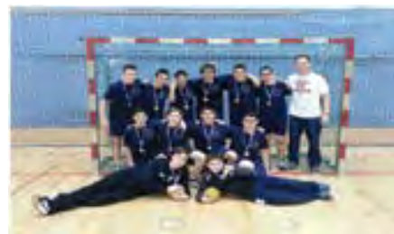
קבוצת הכדוריד בחטיבת גולדה

במסגרת שבוע המעשים הטובים נערך הפנינג מכירות ופעילויות, והבכספים שנאספו נתרמו לעמותות שונות שעוזרות למשפחות ואנשים נזקקים. ברצוני להודות לכל חבריי בהנהגת ההורים בבתי הספר השונים בשכונה שנרתמו לאירגון הפנינג ביחד עם הצוותים החינוכיים בבתי הספר. יישר כח ושתמיד נהיה בצד שנותן ותורם.